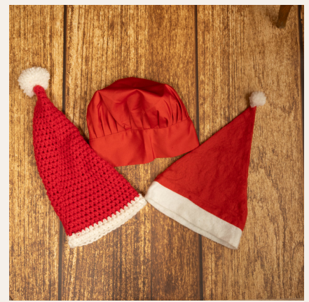
Gorros distintos (hay muchos)

Hay tres delantales para niños y dos delantales para adultos con sus gorros