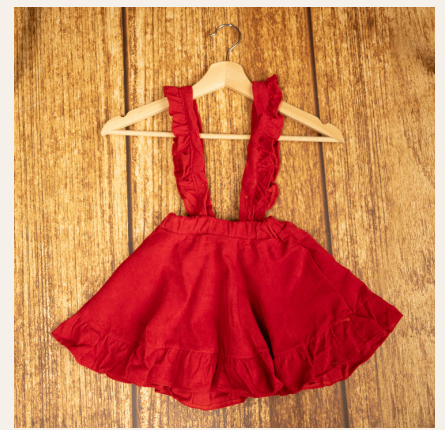
Tallas de la 80 hasta la 130cm