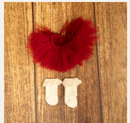
De 1 a 3 meses