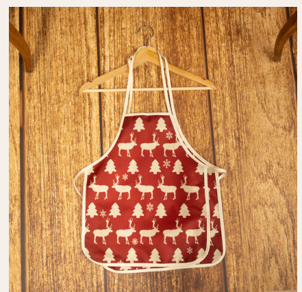
Delantales niños/as y adultos

¡¡¡¡¡MUY IMPORTANTE CALCETINES NEGROS!!!!!!