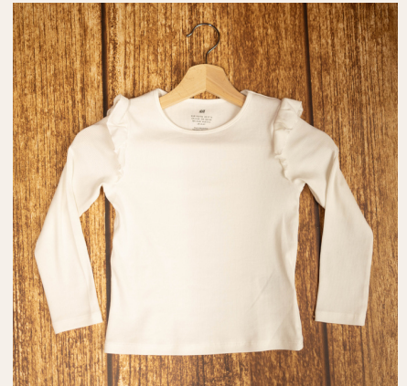
Tallas de la 98 cm a la 140cm