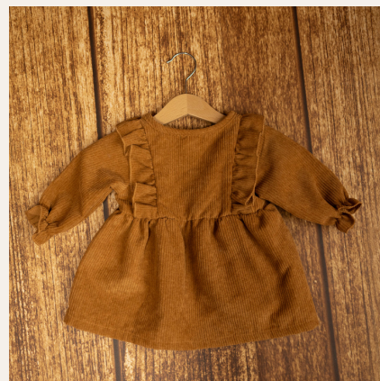
De 3 a 6 meses